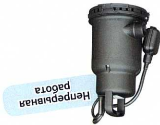
VIP 180/7 auto