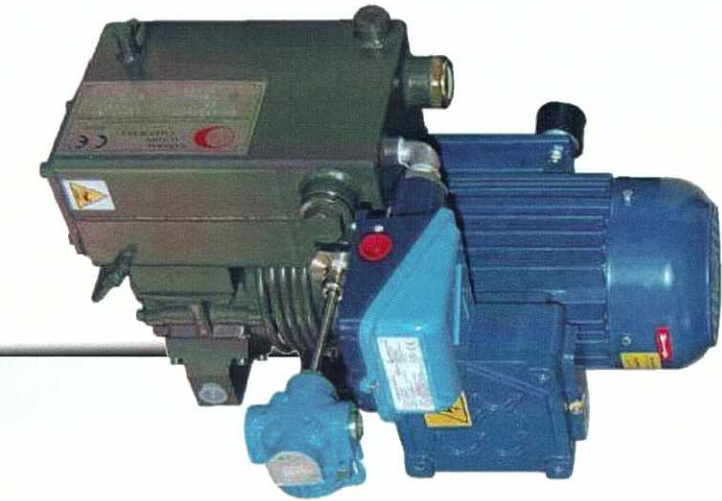
GP 308 ATEX

Все насосы с маркировкой АTEX изготавливаются в полном соответствии с международными нормами для указанных зон взрывоопасности и имеют все соответствующие сертификаты.