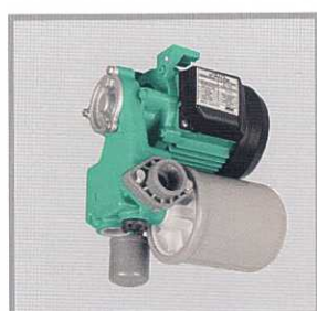
Самовсасывающие установки для водоснабжения Wilo-PW ... EA

Для водоснабжения, полива и орошения, а также для использования дождевой воды.