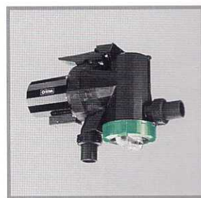
Насосы с мокрым ротором с префильтром Wilo-FITtec FBS

Циркуляция воды бассейнов по DIN 19643, части 1-5.